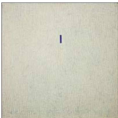
nagrada "Maistra" Rovinj - Dženet Tumpić Premio della "Maistra" Rovigno - Dženet Tumpić