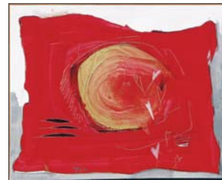
nagrada "Arh studio" Rovinj - Tea Bičić premio dell "Arh studio" Rovigno - Tea Bičić