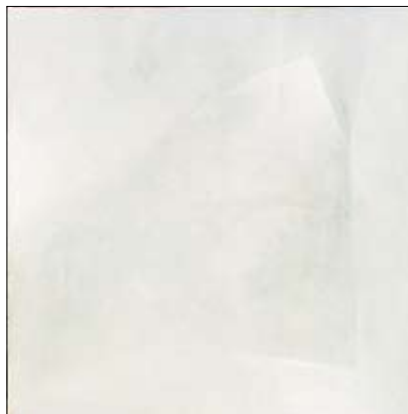
nagrada "Rovinjturist" Rovinj - Dalibor Talajić premio della "Rovinjturist" Rovigno - Dalibor Talajić