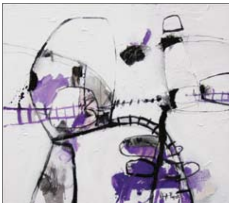
nagrada Turističke zajednice grada Rovinja - Vanja Popek premio della Società turistica della città di Rovigno - Vanja Popek